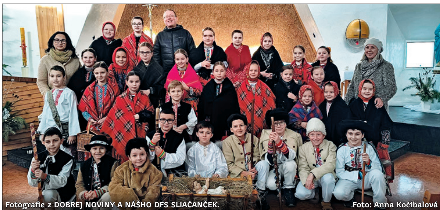
Fotografie z DOBREJ NOVINY A NÁŠHO DFS SLIAČANČEK.