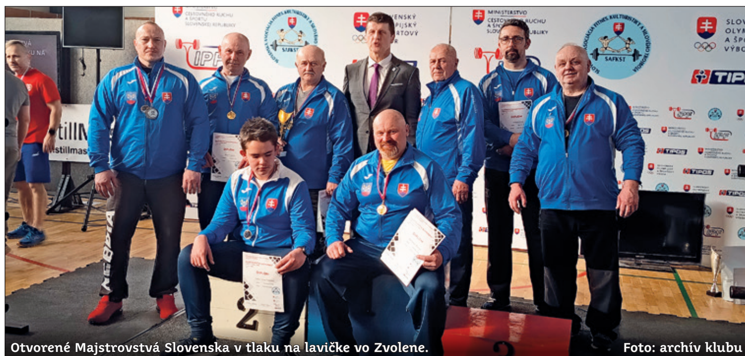
Otvorené Majstrovstvá Slovenska v tlaku na lavičke vo Zvolene.