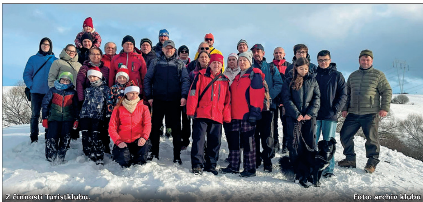
Z činnosti Turistklubu.