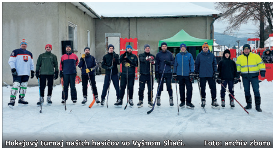
Hokejový turnaj našich hasičov vo Vyšnom Sliači.