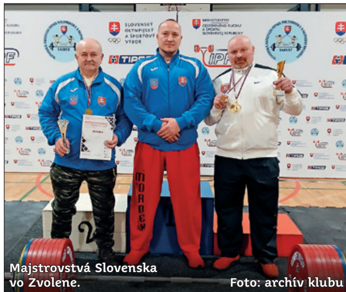
Majstrovstvá Slovenska vo Zvolene.