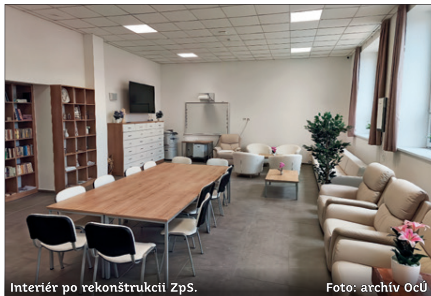
Interiér po rekonštrukcii ZpS.