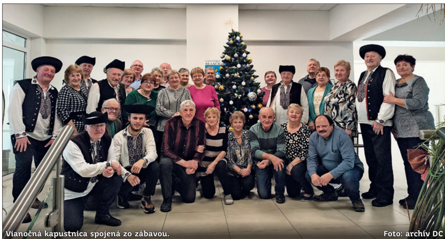
Vianočná kapustnica spojená zo zábavou.