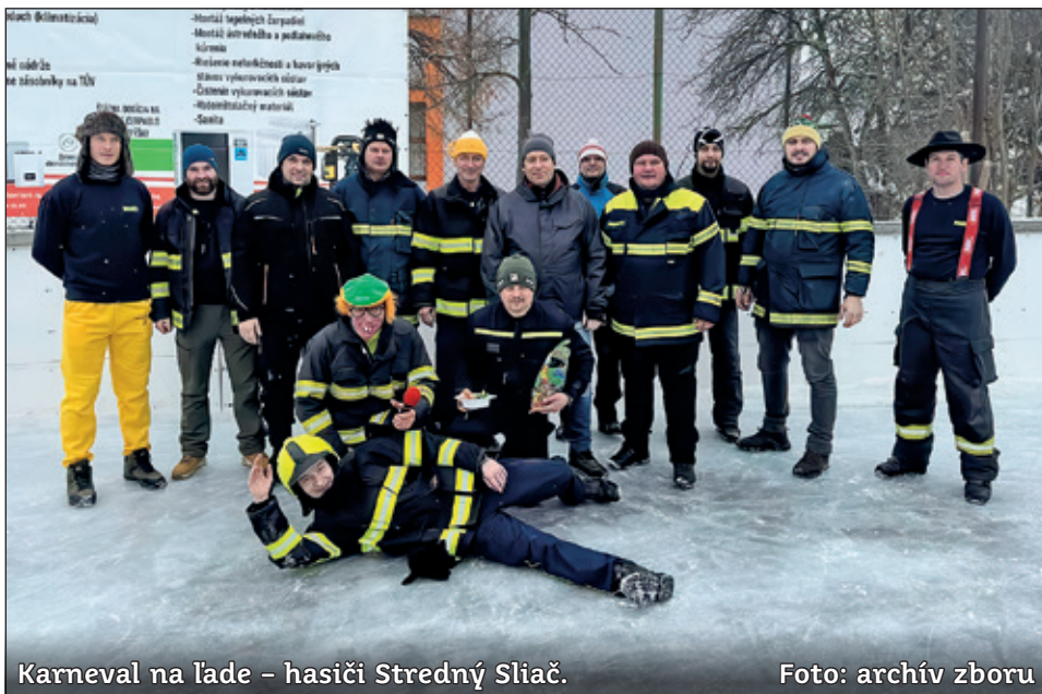
Karneval na ľade – hasiči Stredný Sliač.