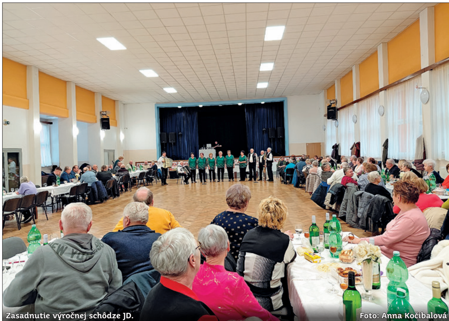
Zasadnutie výročnej schôdze JD.