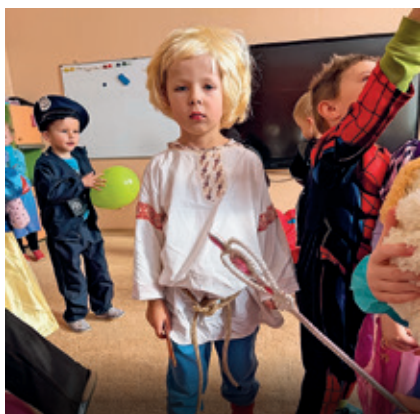
str. 7 Karneval v ZŠ a MŠ