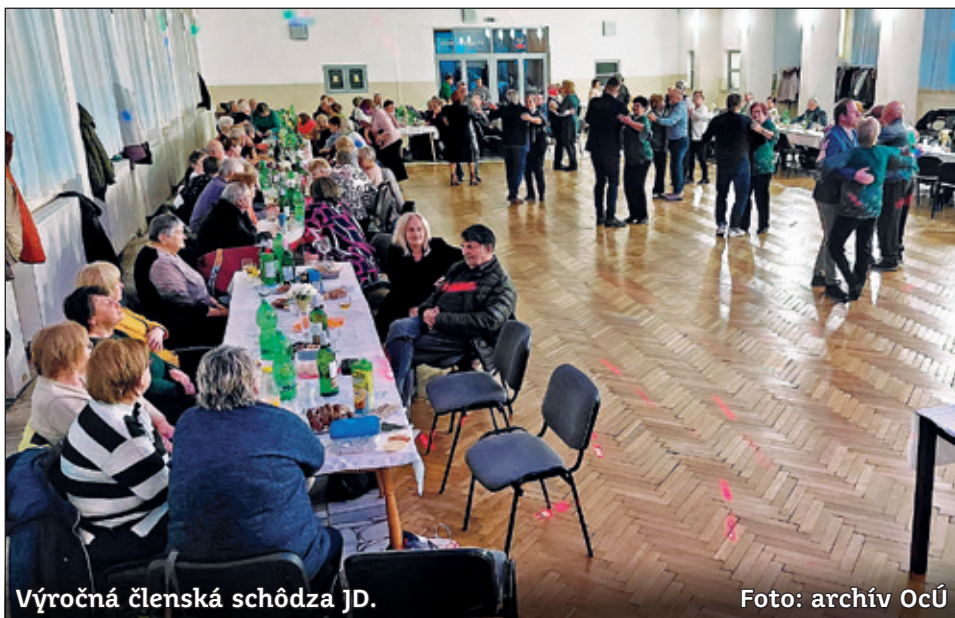
Výročná členská schôdza JD.