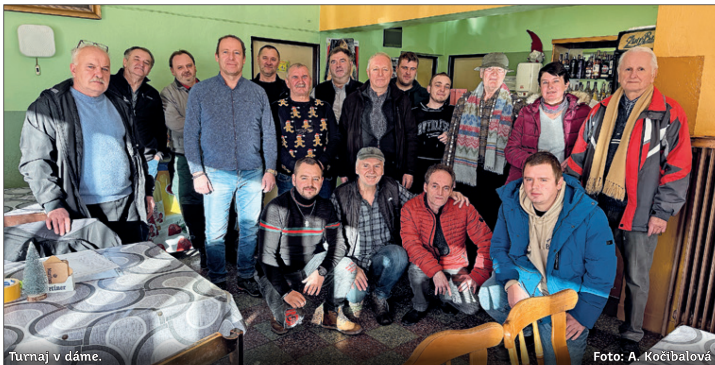
Turnaj v dáme.