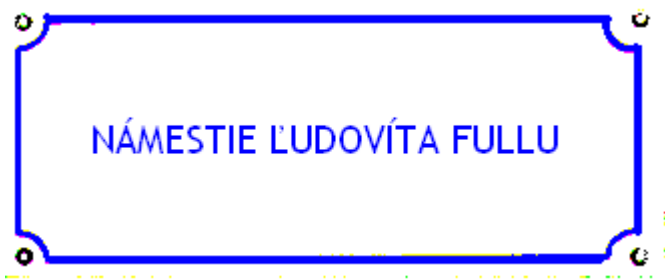
PRÍLOHA č. 2 – Vzor tabuľky s názvom ulice (mierka 1 : 10)