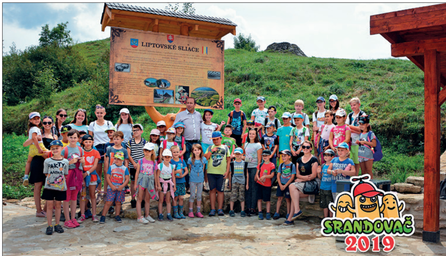
Fotografie z detského tábora v Liptovských Sliachoch.