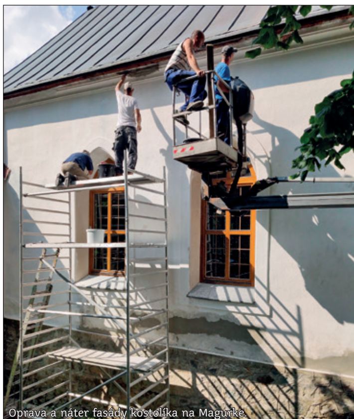
Oprava a náter fasády kostolíka na Magurke.