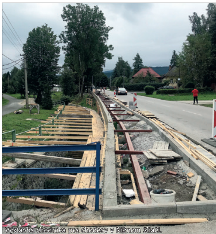
Výstavba chodníka pre chodcov v Nižnom Sliači.